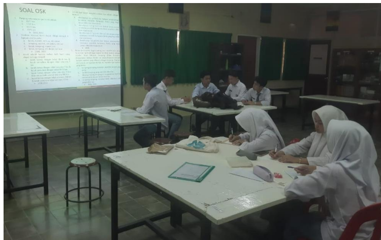
Gambar 5. Kegiatan seleksi tingkat sekolah

Seleksi dilakukan melalui tes berjumlah 80 soal pilihan ganda, dengan total skor maksimum 100 poin. Soal-soal mencakup seluruh materi yang telah diajarkan selama program. Hasil nilai seleksi tingkat sekolah dapat dilihat pada tabel 1 berikut ini.