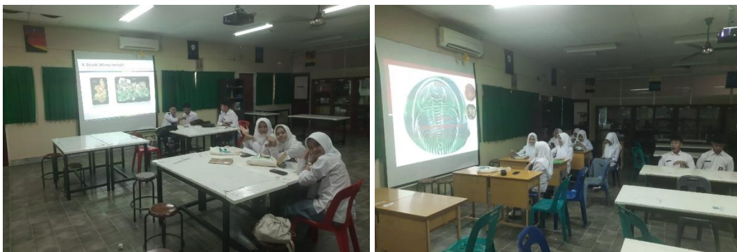
Gambar 3. Kegiatan penyampaian materi

Tahap kedua yaitu memberikan materi mengenai ilmu kebumian berdasarkan silabus materi yang diperlombakan (gambar 3). Materi di sampaikan dengan bantuan media presentasi seperti powerpoint dan video.