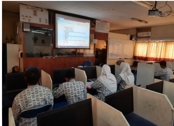
Gambar 2. Proses pelaksanaan kegiatan pretes.

soal pretest yang diberikan bervariasi, antara 10 hingga 20 soal pilihan ganda, disesuaikan dengan cakupan materi pada masing-masing topik. Pre-test dilakukan menggunakan aplikasi Quizizz yang disetting dengan waktu pengerjaan 1 menit per soal menggunakan Gadget maupun komputer. Dalam pengerjaannya siswa diminta untuk tidak melihat buku ajar dan diharapkan menjawab sesuai dengan kemampuannya masing-masing. Hal ini bertujuan untuk melihat kemampuan awal dari tiap siswa dalam mengerjakan soal-soal olimpiade kebumian.