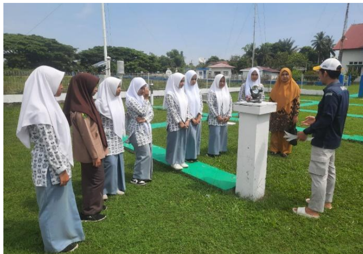
Gambar 4. Kegiatan praktikum lapangan di BMKG Stasiun Meteorologi Malikussaleh

Tahap ketiga yaitu kegiatan praktikum lapangan bekerja sama dengan BMKG Stasiun Meteorologi Malikussaleh (gambar 4).