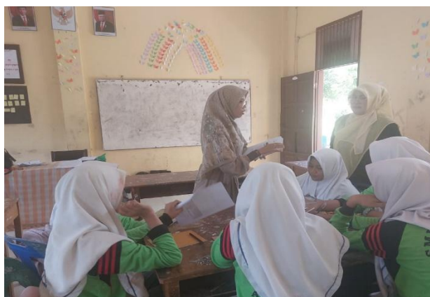
Gambar 7. Tahap tindak lanjut kegiatan pengabdian

Tahap selanjutnya yaitu pendampingan lanjutan. Pada tahap ini dilakukan diskusi terbuka bersama siswa dan guru pembina untuk mengevaluasi manfaat kegiatan, materi yang perlu ditambah, dan kendala yang dihadapi. Memberikan rekomendasi bagi guru dan siswa untuk kegiatan latihan rutin setelah kegiatan pengabdian selesai (Gambar 7).